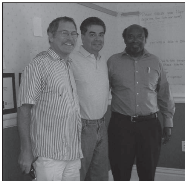
CCGHR Board members from Canada, Kenya and Mexico

TG on Global Indigenous Health Research: At its June retreat, the BOD approved the creation of a new task group — the Task Group on Global Indigenous Health Research. The focus will be on the health of indigenous peoples not only in high-income countries (such as Canada) but also in LMICs.